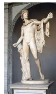
Apollon du Belvédère, Léocharès, Ve s. av. J.-C.

A : Si j'ai dû remédier à cet acte, ce n'était pas pour acquérir le temple de l'oracle, c'était pour défendre ma mère Léo. En effet, alors que j'étais tout enfant, Python pourchassa ma mère sur ordre d'Héra. Si je ne tuais pas Python de mon arc, il aurait sans aucun doute abattu ma chère mère. Cependant, pour apaiser Gaïa, j'ouvris les Jeux Olympiques.