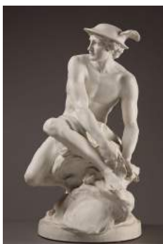
Mercure attachant ses talonnières, Pigalle, 1744.

Mercure : Cette affaire s'est fort bien terminée ! Avant que ce cher Apollon ne me retrouve, j'ai fabriqué un instrument produisant un son des plus merveilleux. Je l'ai appelé lyre. Quand Apollon m'a retrouvé, je lui ai rendu ses vaches et lui ai donné la lyre pour en finir. Et voilà, fin de l'histoire. Apollon n'aurait certainement pas attaqué un enfant en justice ! Mais quel naïf ! J'ai sacrifié quelques unes de ses vaches et lorsque je lui ai rendu son troupeau, il n'a même pas pris la peine de compter ses bêtes ! Je croise Apollon de temps en temps, nous échangeons des banalités, rien d'intéressant.