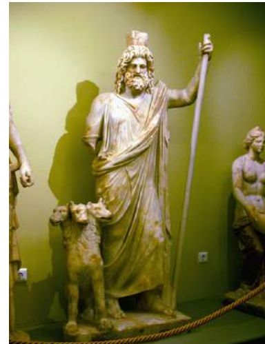
Hadès et Cerbère, 2008

aidé par Cerbère qui s'occupe de garder la porte des Enfers. Je porte également mon bident et mon casque Kunée dont je vous ai déjà parlé.