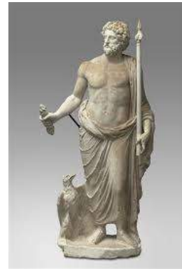
Sculpture de Jupiter accompagné de l'aigle, Hervé Lewandowski

j'avais libérés. Ils ont eu une très grande importance dans ma victoire contre Cronos. Cette bataille a été longue et épuisante mais j'ai fini par y arriver. Après avoir capturé Cronos, je l'ai jeté dans les profondeurs du Tartare avec ses titans. Maintenant, les Hécatonchires sont chargés de les surveiller.