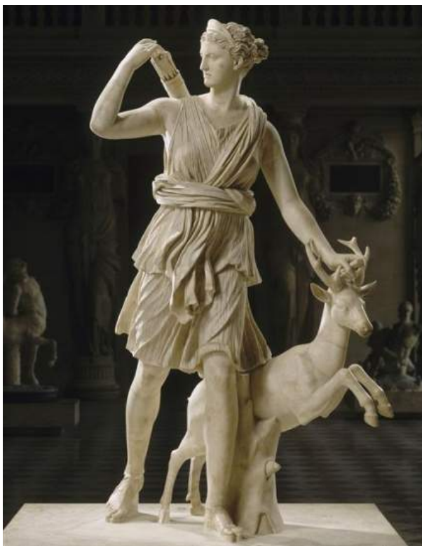
Diane de Versailles, statue en marbre réalisée par Léocharès et Barthélemy Prieur au IV e avant J.-C.

Artémis : Évidemment que je le mérite ! Je suis tout de même Artémis, la déesse de la chasse et de la Lune ! Et pour répondre à votre première question, oui, parfois, bien-sûr, c'est difficile de gérer mon temple de Rome, d'Italie, ou encore celui d'Éphèse (je ne les compte même plus !), mais le simple fait que mes fans me montrent leur adoration me donne de la force chaque jour pour continuer à être ce que je suis aujourd'hui.