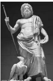
Statue du dieu grec Zeus

J : J'ai un sceptre qui représente la royauté. L'égide qui est une arme redoutable, elle sert aussi à déclencher des orages. Le chêne, symbole de la puissance et de la force. L'aigle est un symbole céleste. Je possède aussi la foudre qui a été fabriqué par les cyclopes. Elle a trois niveaux de déclenchement, le premier est pour avertir, le deuxième pour punir et le troisième pour tuer.