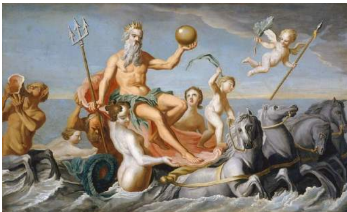
Le Retour de Neptune, 1754

N : Oui c'est vrai, mais surtout avec Athéna. Un jour, on s'est battu et elle a gagné ce qui m'a rendu furieux !