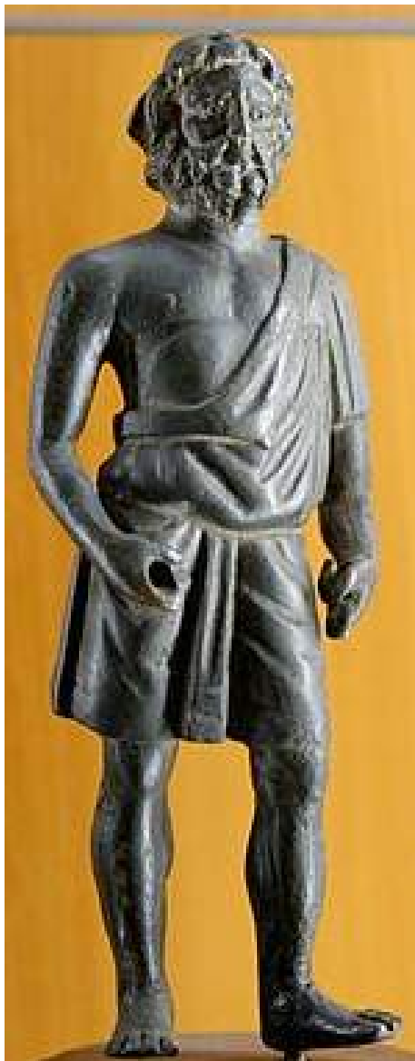
Ier siècle ap. J.-C.

Or, le métier de forgeron n'est pas tous les jours facile ; il demande de la force, de l'agilité et est plutôt fatigant. Pourquoi avoir choisi ce métier ?