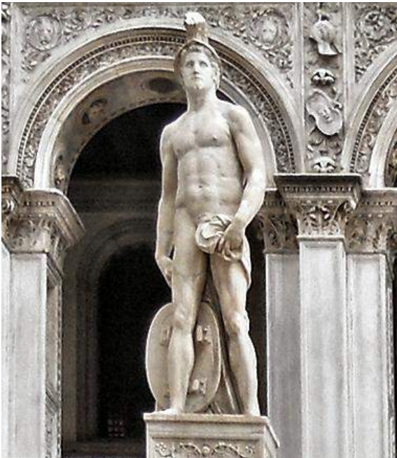
Statue de Mars, Sansovino, 1554

Mars : En effet, je possède un symbole, il montre mon glaive et mon bouclier, ces deux objets signifient la guerre. C'est pourquoi j'ai demandé à beaucoup d'artistes de me représenter avec ce symbole.