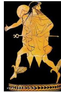
Hermès, vase grec de l'époque archaïque (-900 à -600 av JC)

autonome très jeune. J'ai pu être éduqué par Acacos.