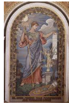
Minerve, Elihu Vedder, XIXe s.

M : Il faut que vous sachiez quelque chose. Ce n'est pas parce que je suis la fille préférée de Zeus que cela me permet de tout faire justement. Je ne dois pas tâcher son nom et le respecter. Pour moi, être sa fille préférée est un signe d'une extrême confiance.