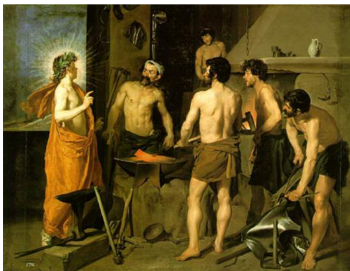
La Forge de Vulcain, Diego Velázquez, 1630

lave me tient chaud ce qui me permet de forger les traits de foudre de mon père.