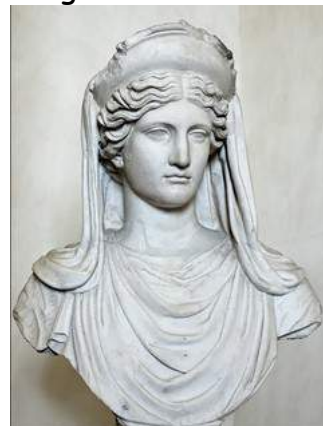
Statue de Cérès

dix jours, je la cherchais jour et nuit ! Lors de mon voyage, j'ai croisé la déesse Hécate, qui m'a dit d'interroger le Soleil.