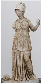
Statue de Minerve, IIe s.

Minerve : Cet enfant est d'Héphaïstos, il m'a poursuivi de ses avances, son sperme s'est répandu sur ma cuisse, je l'ai essuyée avec de la laine, que j'ai jetée à terre. La terre a ainsi fécondé. Celle-ci donna naissance à Érichthonios puis je l'ai recueilli et élevée. J'ai un autre enfant qui s'appelle Dédale.